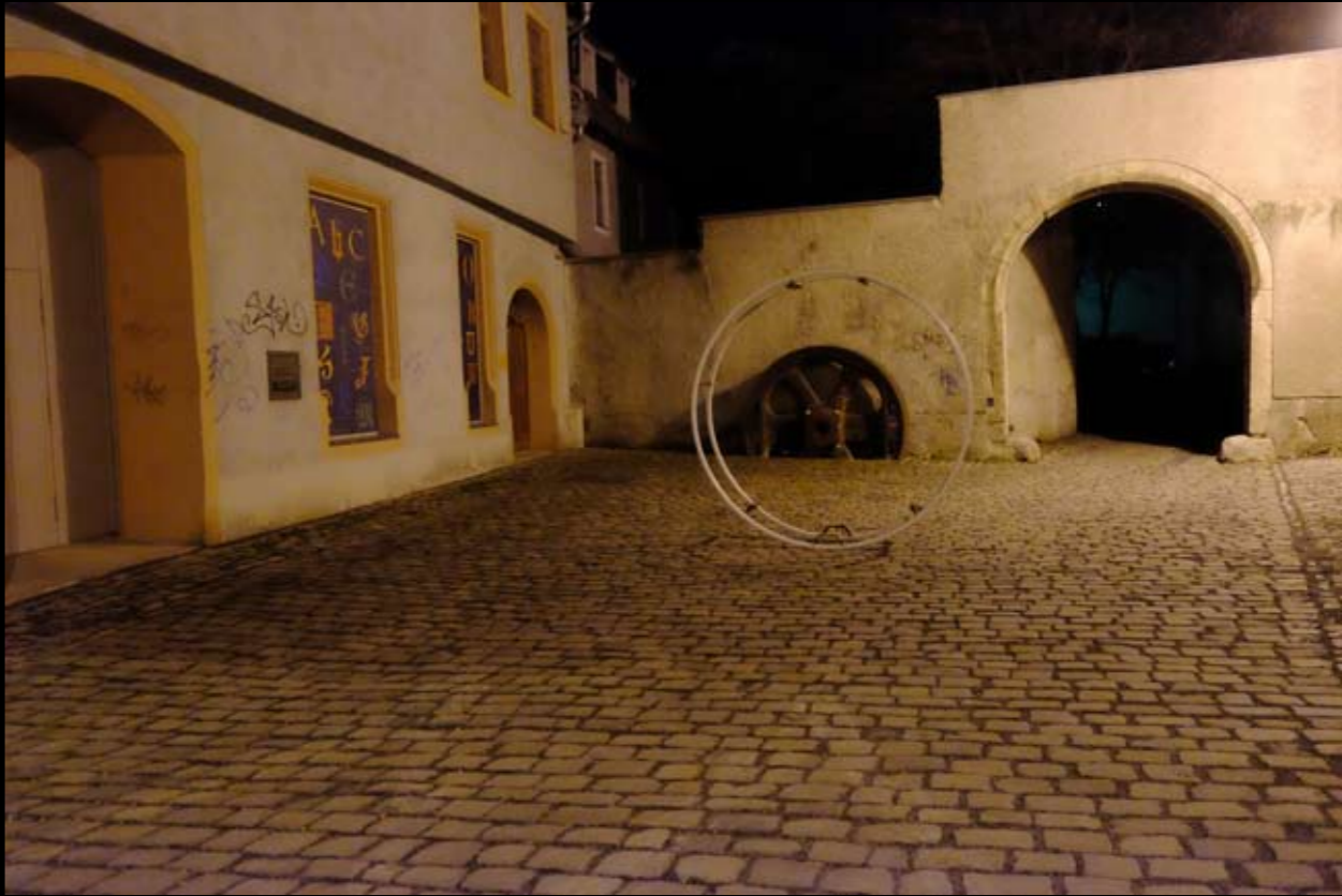
12 Weimar • Thüringen • Deutschland