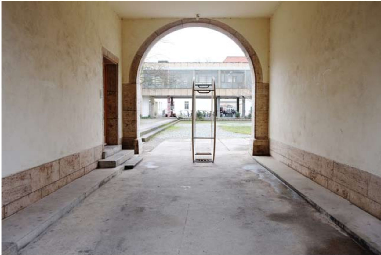
12 Bauhaus-Universität • Geschwister-Scholl-Straße • Weimar • Thüringen • Deutschland