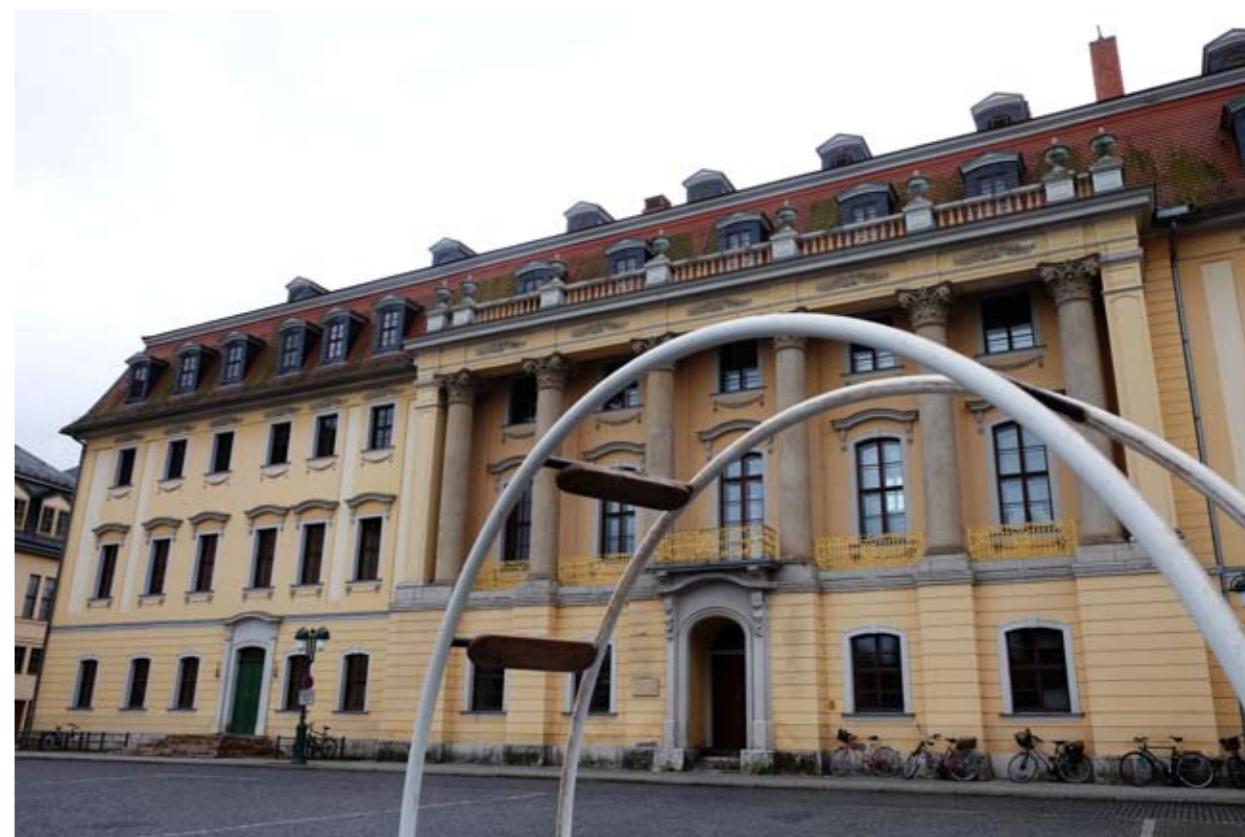
12 Hochschule für Musik Franz Liszt • Platz der Demokratie • Weimar • Thüringen • Deutschland