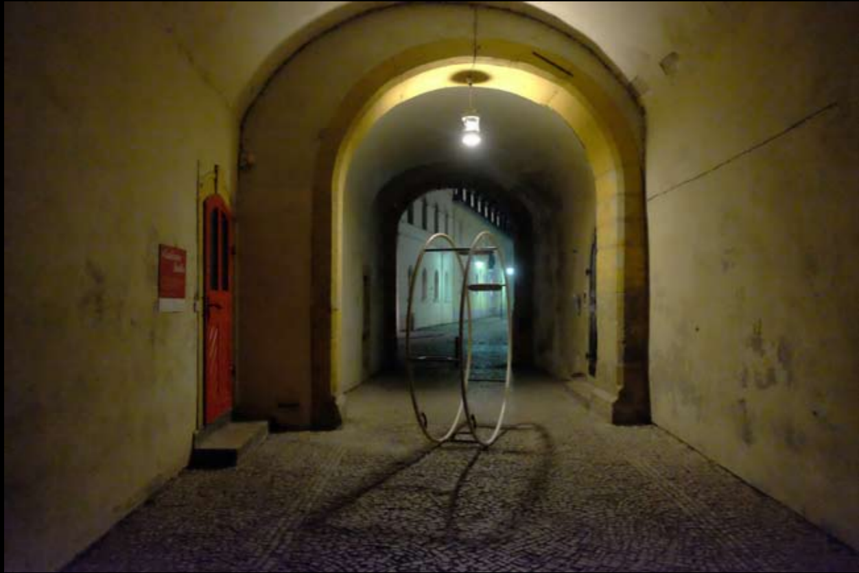
12 Stadtschloss • Weimar • Thüringen • Deutschland