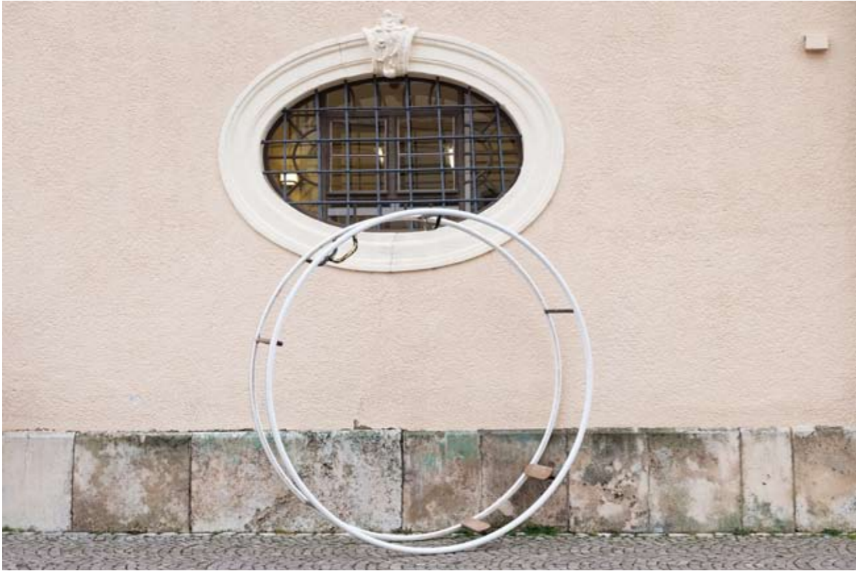
12 Herzogin Anna Amalia Bibliothek • Platz der Demokratie • Weimar • Thüringen • Deutschland