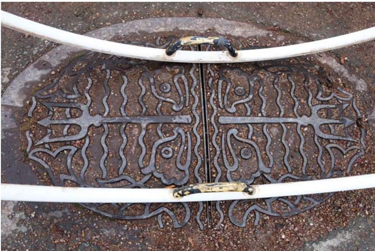
12 Weimar • Thüringen • Deutschland