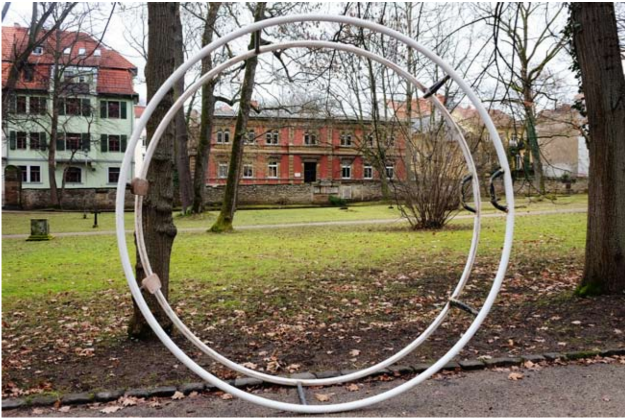
12 Alter Friedhof • Weimar • Thüringen • Deutschland