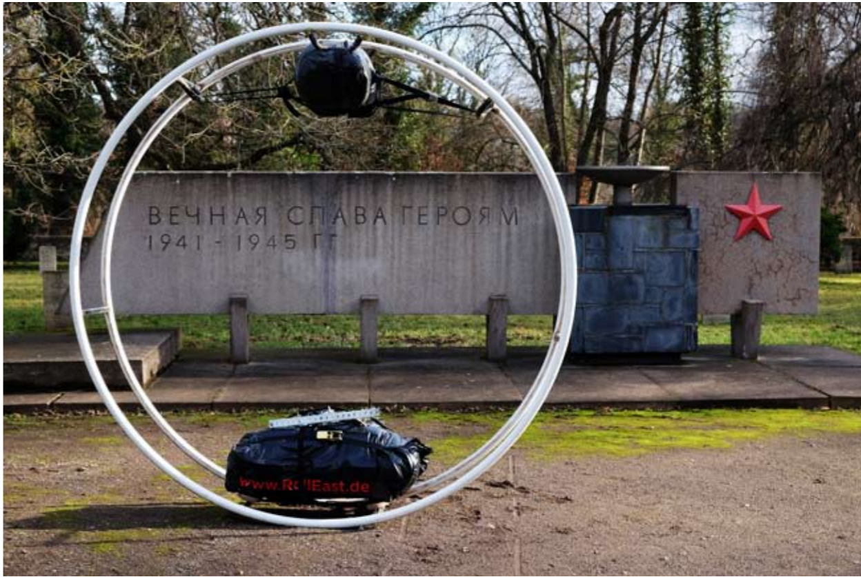
13 Sowjetischer Ehrenfriedhof • Park an der Ilm • Weimar • Thüringen • Deutschland