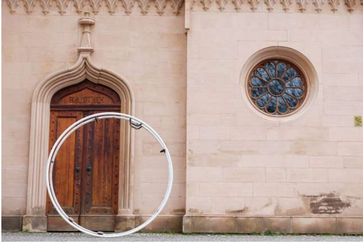
12 Herzogin Anna Amalia Bibliothek • Platz der Demokratie • Weimar • Thüringen • Deutschland