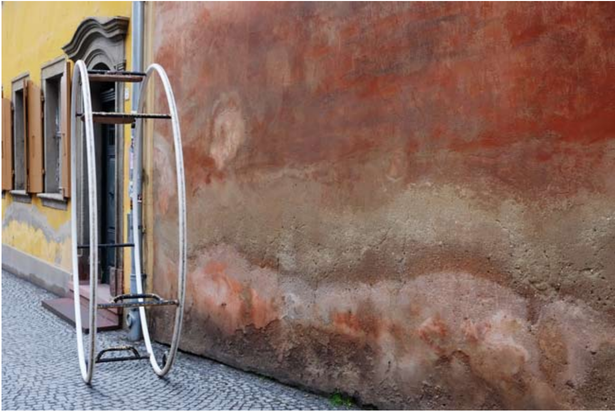
12 Frauenplan • Weimar • Thüringen • Deutschland