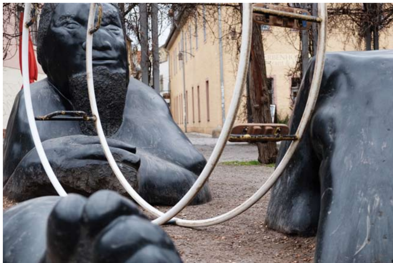
12 Versunkener Riese • Frauenplan • Weimar • Thüringen • Deutschland