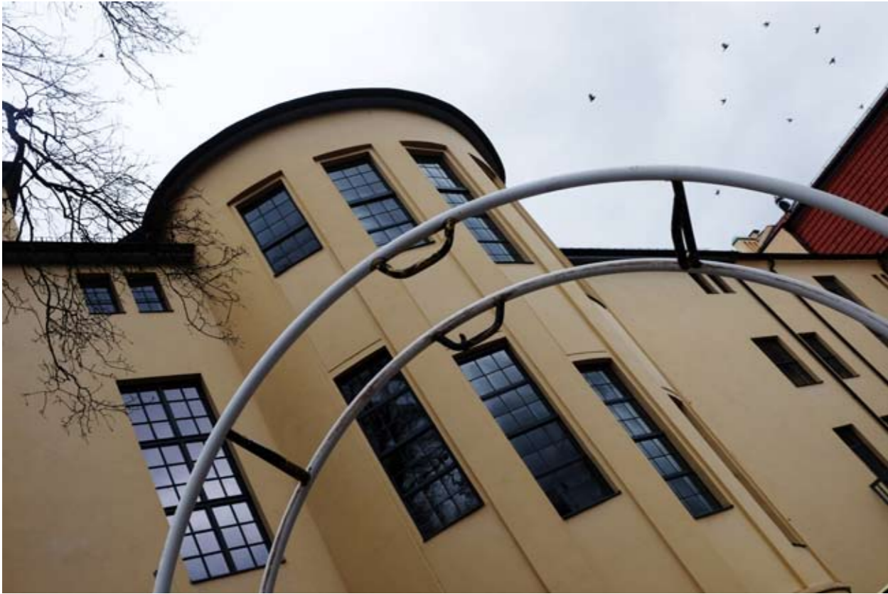
12 Bauhaus-Universität • Geschwister-Scholl-Straße • Weimar • Thüringen • Deutschland