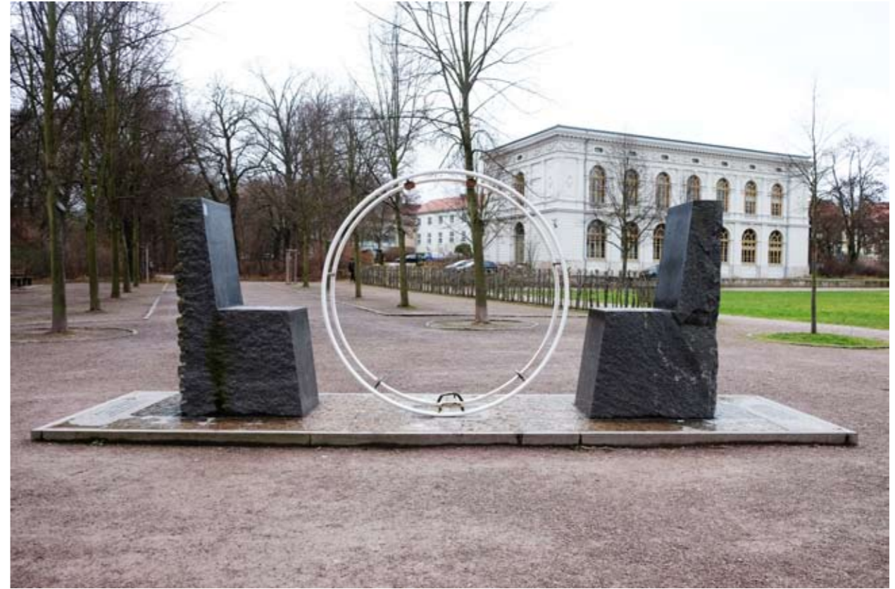
12 Hafis-Goethe-Denkmal • Park an der Ilm • Weimar • Thüringen • Deutschland