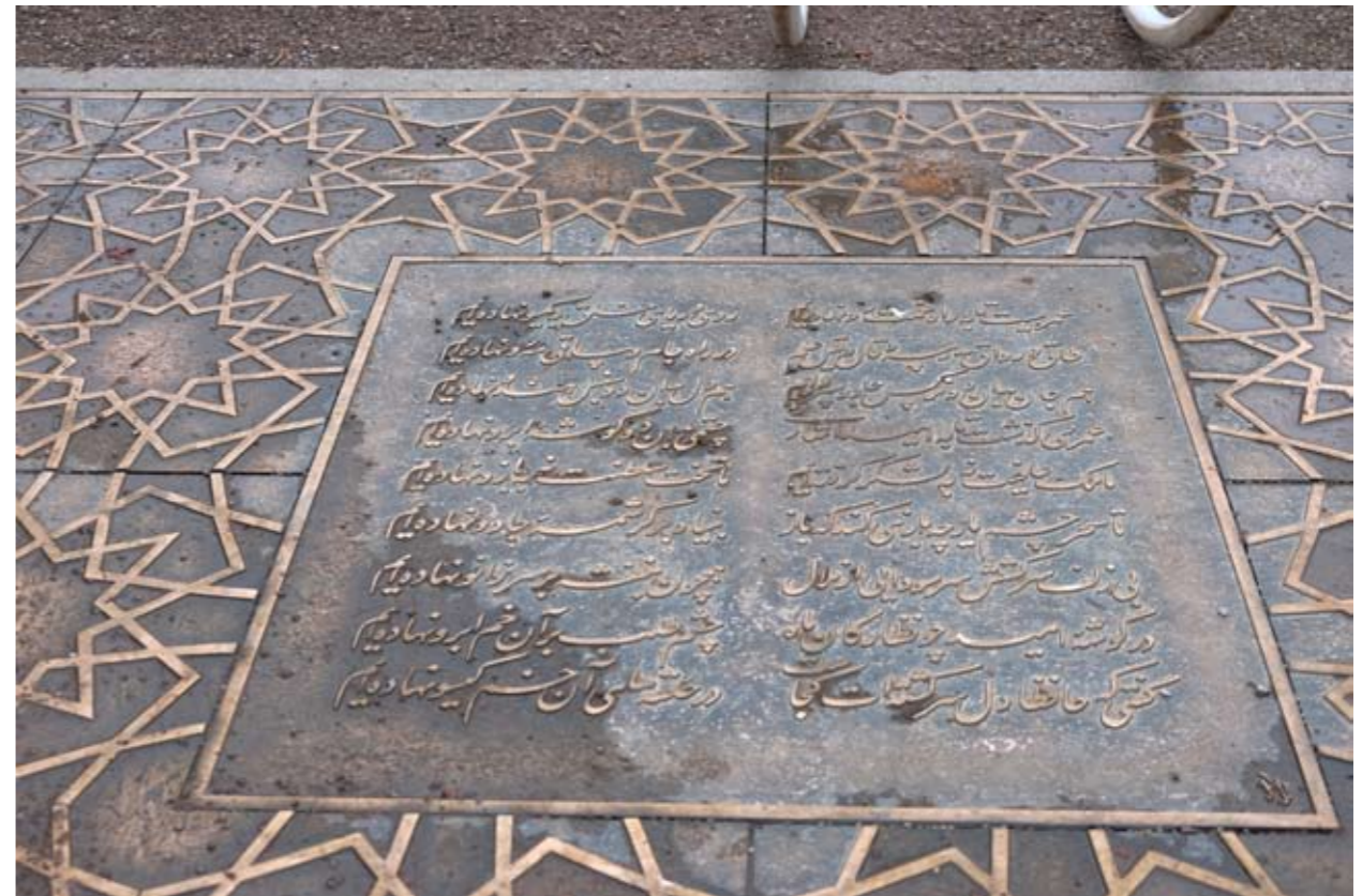
12 Hafis-Goethe-Denkmal • Park an der Ilm • Weimar • Thüringen • Deutschland