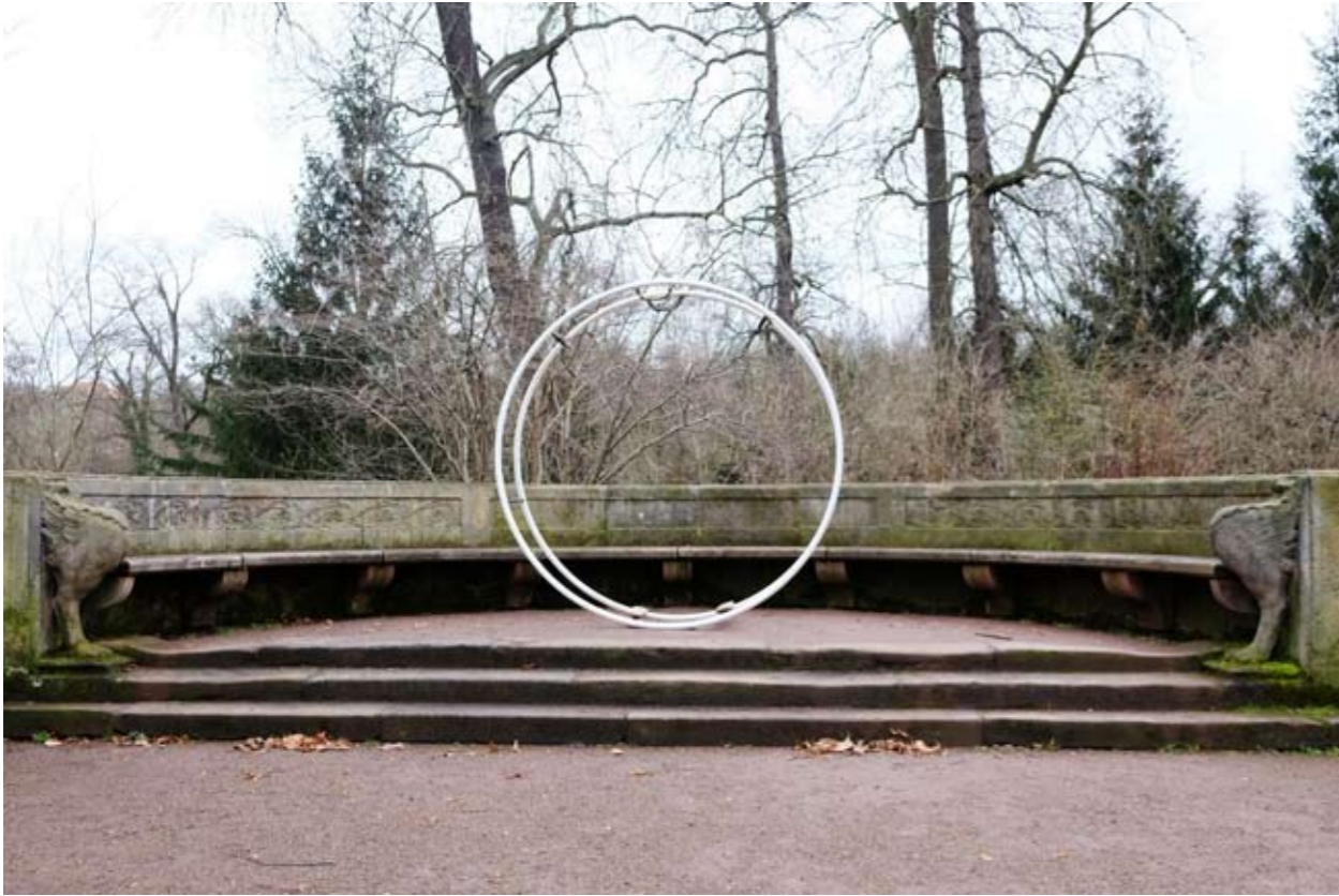
12 Pompejanische Bank • Park an der Ilm • Weimar • Thüringen • Deutschland