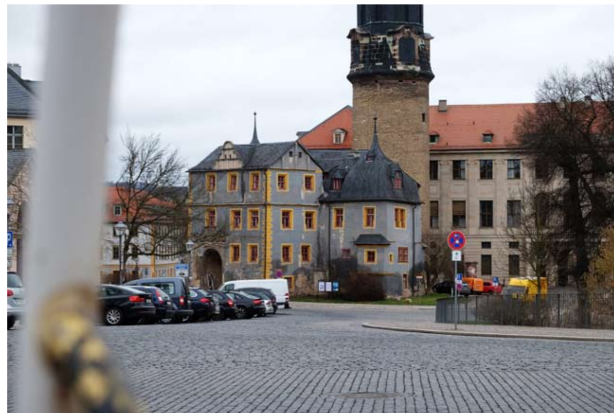
12 Stadtschloss • Platz der Demokratie • Weimar • Thüringen • Deutschland

Buchenwald, das Stadtschloss, das Schloss Belvedere, das Wohnhaus von Schiller und das von Liszt und das von Goethe ... Apropos Goethe: Der Dichter lebte viele Jahre in Weimar und verfasste zahlreiche Gedichte. Zum Beispiel den durch den persischen Dichter Hafis inspirierten Gedichtband West-östlicher Divan, aus dem die berühmten Zeilen stammen: „Wer sich selbst und andere kennt, wird auch hier erkennen: Orient und Okzident sind nicht mehr zu trennen.“ Ein Denkmal aus zwei gegenüberstehenden Stühlen erinnert heute an die intellektuelle Verbindung zwischen Hafis und Goethe. Wie passend.