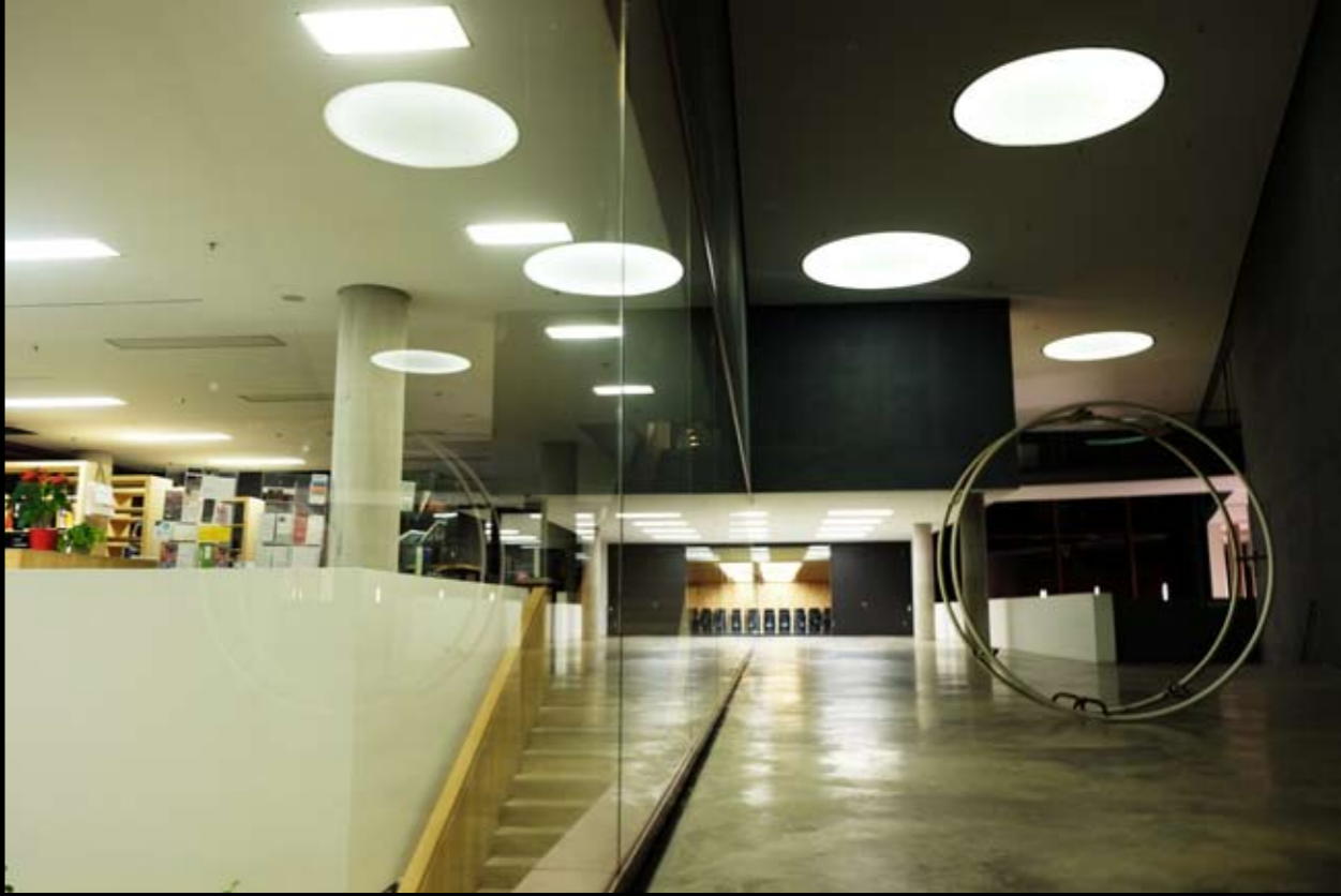
12 Universitätsbibliothek • Geschwister-Scholl-Straße • Weimar • Thüringen • Deutschland