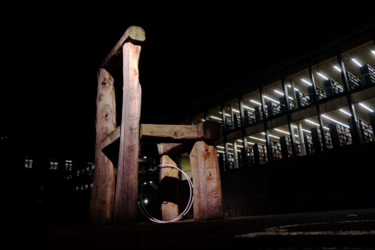
12 Universitätsbibliothek • Geschwister-Scholl-Straße • Weimar • Thüringen • Deutschland