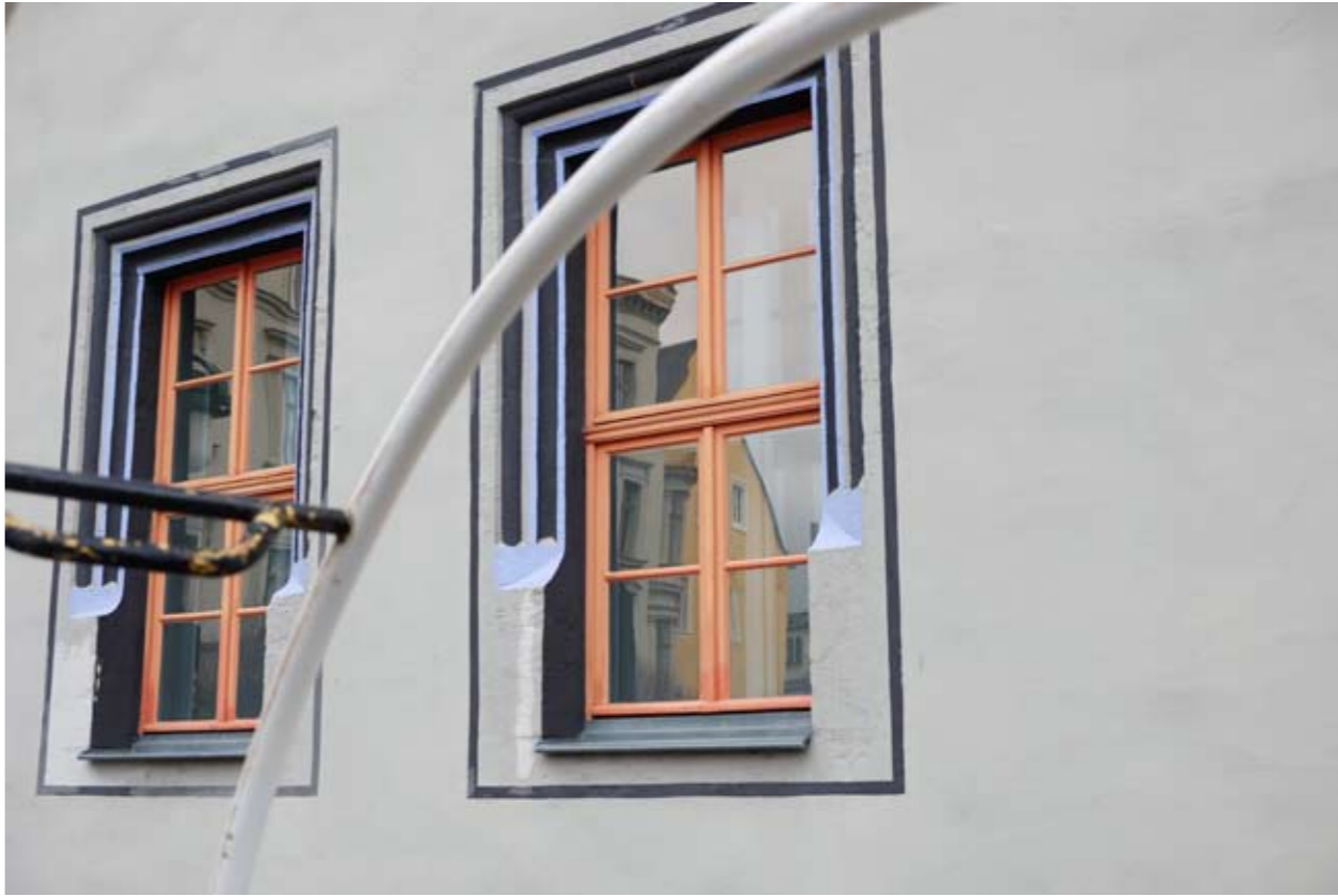
12 Markt • Weimar • Thüringen • Deutschland